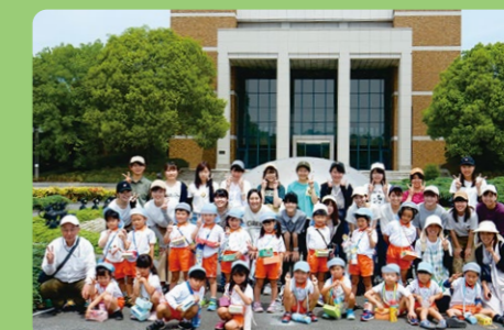
● 子ども臨床基礎演習（1年次）