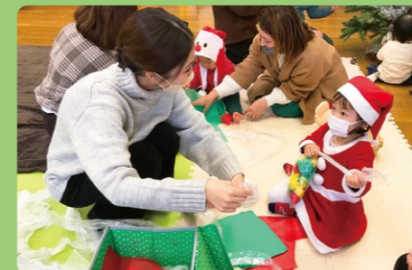
● 保育内容（人間関係）の指導法（1年次）

子ども学科の授業は、学科の特徴を生かすとともに、アクティブラーニングを積極的に導入しています。