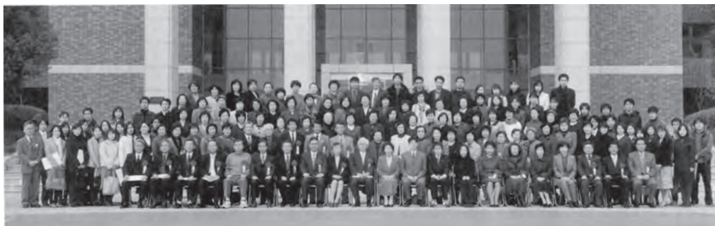
同窓会 設立総会 (2002. 1.13)