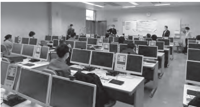
画像解析に関する技術講習会

岡山県、岡山県経済団体連絡協議会、(公財) 岡山県産業振興財団、岡山県商工会連合会、(一社) 岡山工業会、(一社) システムエンジニアリング岡山、総社市