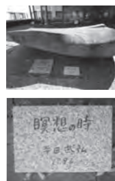
岡山県立短期大学 旧校舍跡地 記念碑「瞑想の時」