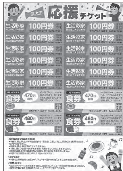
県大生応援チケット